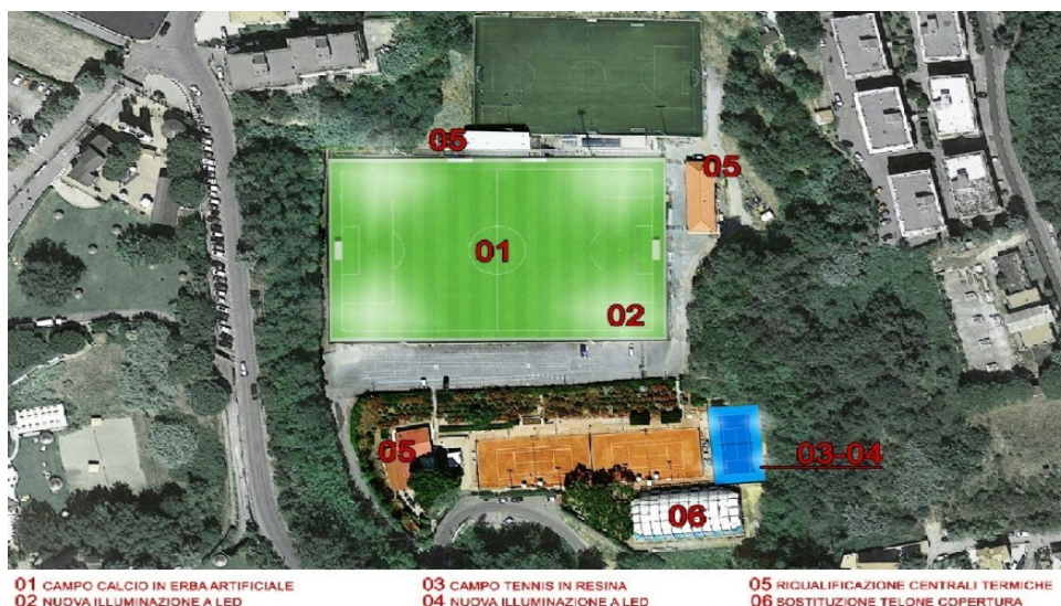
01 CAMPO CALCIO IN ERBA ARTIFICIALE 02 NUOVA ILLUMINAZIONE A LED 03 CAMPO TENNIS IN RESINA 04 NUOVA ILLUMINAZIONE A LED 05 RIQUALIFICAZIONE CENTRALI TERMICHE 06 SOSTITUZIONE TELONE COPERTURA